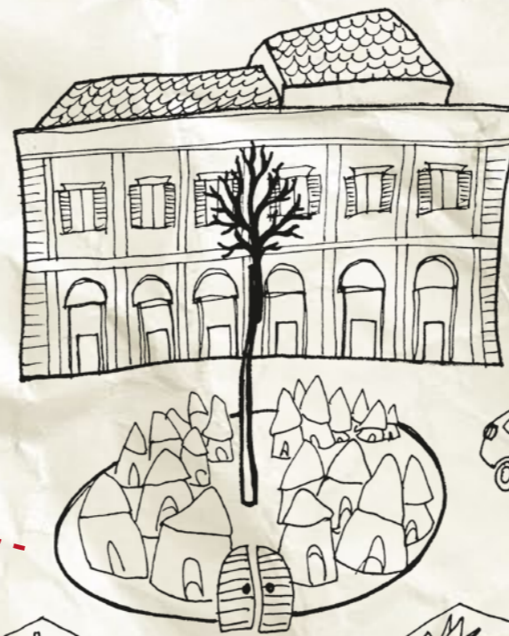
TEATRO GARIBALDI PIAZZA REGINA MARGHERITA Piazza Margherita di Savoia