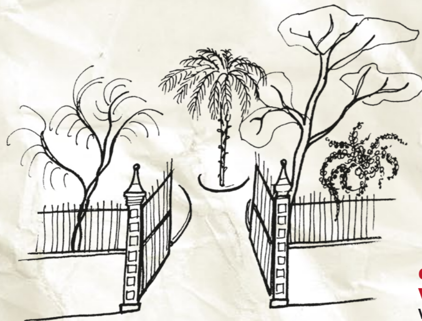
GIARDINO BOTANICO VENEZIANI Via Ariosto