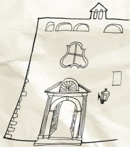
SANTA CROCE [EX MONASTERO] Via Giulio Frisari, 1