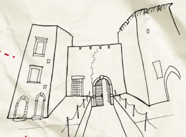
CASTELLO SVEVO ANGIOINO Largo Castello